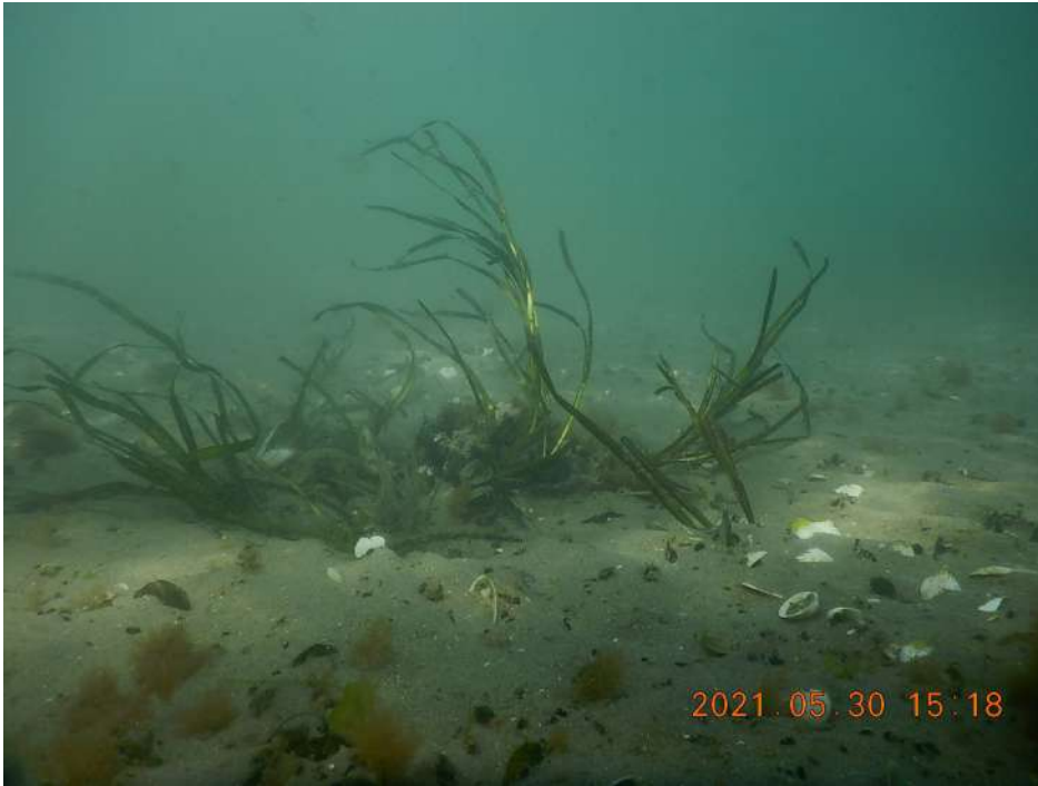
Morceaux de rhizomes juste après transplantation (ZoRRO 1)

Plage de Figuerolles Photo du 30 mai 2021