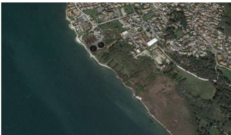
Anse des Saint Chamas (sud du lavoir des pestiférés) Très peu de zostères naines en 2020 (plus récent passage de Google Earth)