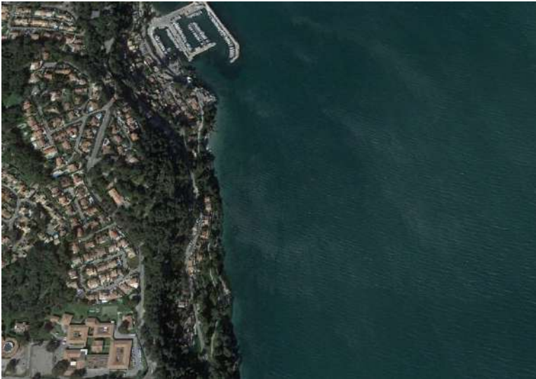
Côte rocheuse d'Istres (1 km sud du port des Heures Claires) Très peu de taches de zostères naines encore