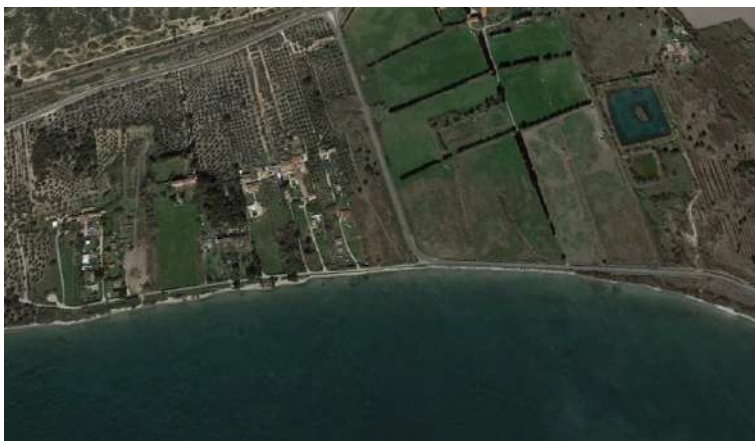
Anse des Merveilles Aucune zostères naines en 2020 (plus récent passage de Google Earth)