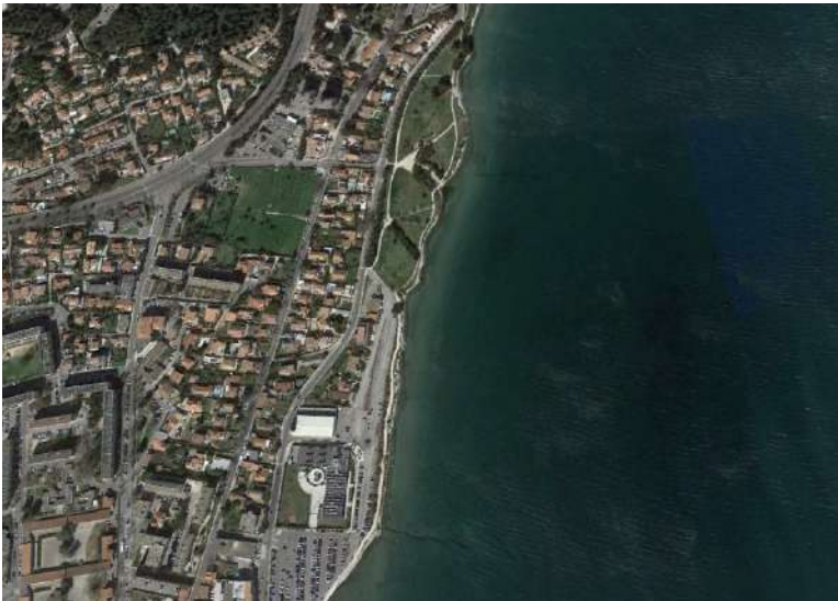
Jardí de la Rode à Martigues Très peu de taches de zostères naines encore