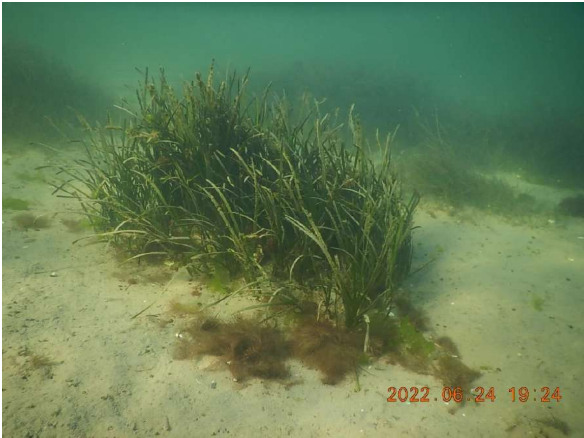
Tache de zostères marine plantée lors de ZoRRO#1 (par bouturage). La tache a 1 an et son développement au premier semestre 2022 a été très encourageant

Les permanences sont que nous continuons les deux méthodes (bouture et graine) et, dans le cas des graines, les deux sous-méthodes de bouées dispersantes et des sachets de jutes (sauf que cette fois les sachets seront remplis par des graines mures issues de l'unité de maturation).